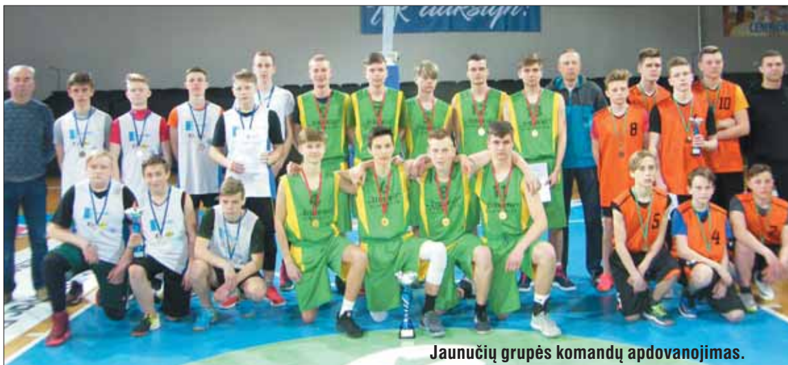
Jaunučių grupės komandų apdovanojimas.