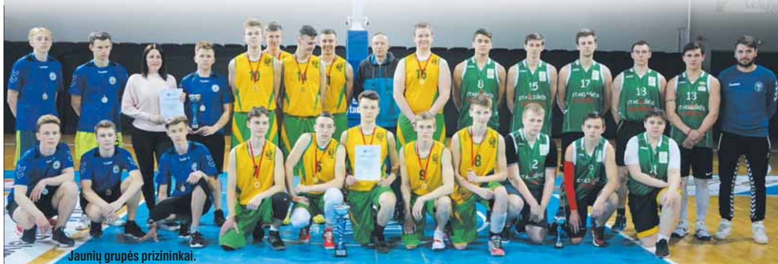
Jaunių grupės prizinininkai.