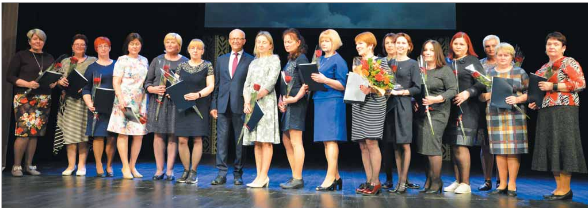
Mero padėkomis padovanoti rajono medicinos darbuotojai.