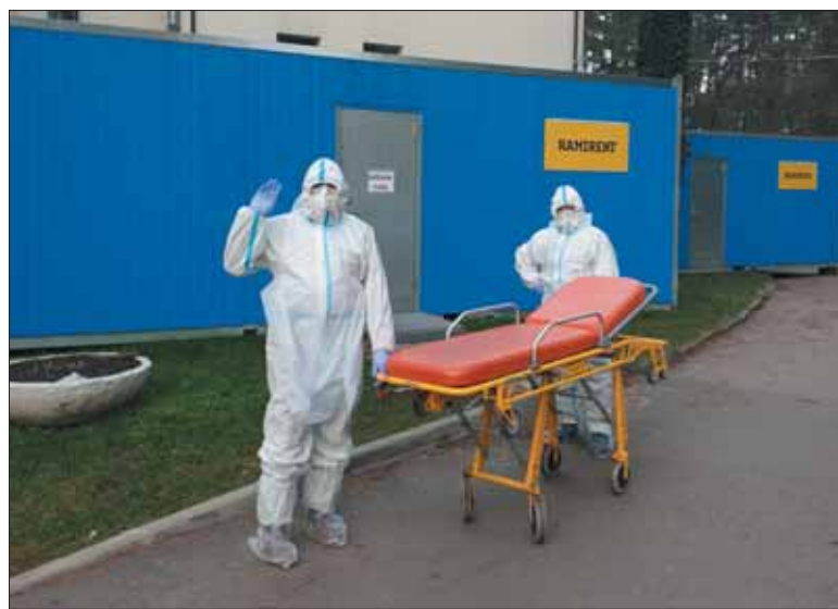
Prienų ligoninės COVID-19 poskyrio darbuotojai.

Gruodžio 9 dienos duomenimis, sergančiųjų buvo šiek tiek daugiau: 25 pacientai buvo gydomi COVID-19 poskyryje, vienas – COVID-19 reanimacijoje, keturi – palaikomojo gydymo ir slaugos skyriuje.