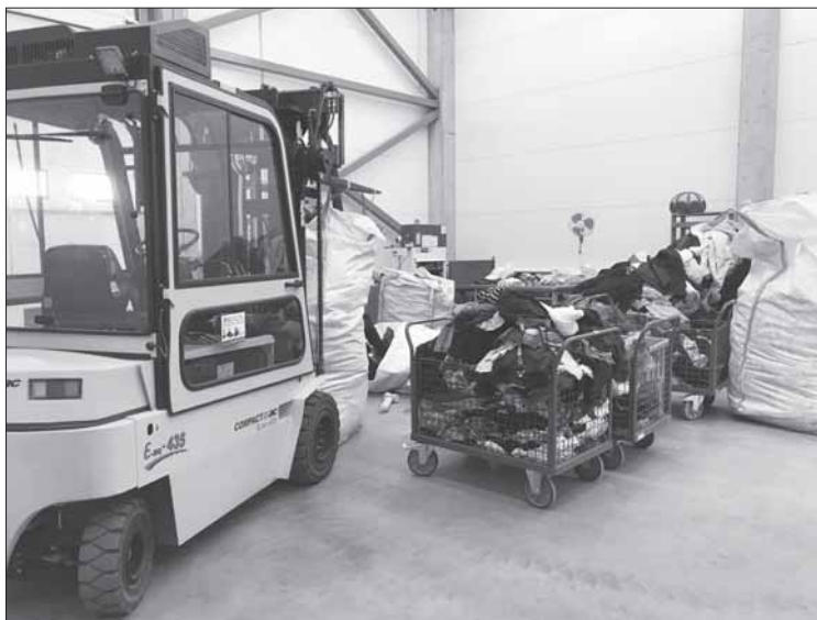
Tekstilės konteineriais surenkama daug dar gerų drabužių bei avalynės – sutvarkytus šiuos daiktus galima toliau naudoti.