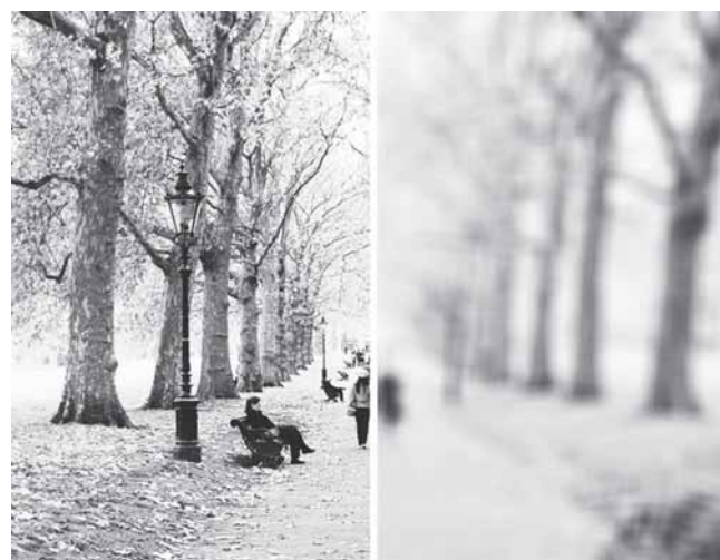
Sergant katarakta vaizdai tampa neryškūs, matomi tarsi pro rūką ar nešvarius akinius

Pastebėjus pirmuosius ligos požymius reikėtų ilgiai nedelsti ir pasikonsultuoti su gydytoju. Dažnai žmonės, sužinoję apie ligą, mano, kad operaciją galima atidėti vėlesniam laikui, tačiau tai yra klaidingas mąstymas. Kataraktos operacija ir gydymas yra daug sėkmingesnis ligos pradinėje stadijoje, kol nėra labai ryškių pakitimų. Per ilgai laukiant liga progresuoja ir išsivysto vadinamoji perbrendusi katarakta, kuri gali nulemti antrinės glaukomos ar akies skausmų pasireiškimą. Tokiais atvejais kataraktos operacija būna techniškai sudėtinga, padidėja pooperacinių komplikacijų rizika, regėjimas atsistato per ilgesnį laikotarpį. Jeigu dėl antrinės glaukomos žūsta nervas – regėjimo susigrąžinti nebeįmanoma.