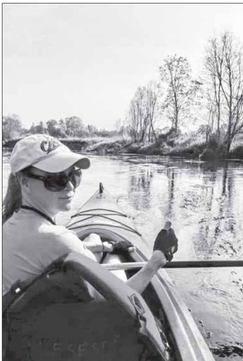
Verslininkė sakė, kad ES parama suteikė jos ir vyro verslui didelių galimybių.

„Anksčiau gautą paramą naudojome ir pirmajai interneto svetainei kurti, ir kompiuteriui bei spausdintuvui pirkti, ir pirtelėms, kubilui ar vaikų žaidimų