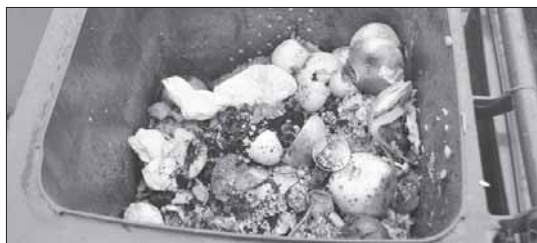
Regiono gyventojai gero maisto nešvaisto – atliekų konteineriuose daugiausia atsiduria tai, kas lieka jį gaminant.

Tai gali būti viena priežasčių, kodėl mūsų šalies gyventojai nėra didžiausi maisto švaistūnai – iš gyventojų surenkamose maisto atliekose aptinkama santykinai nedaug