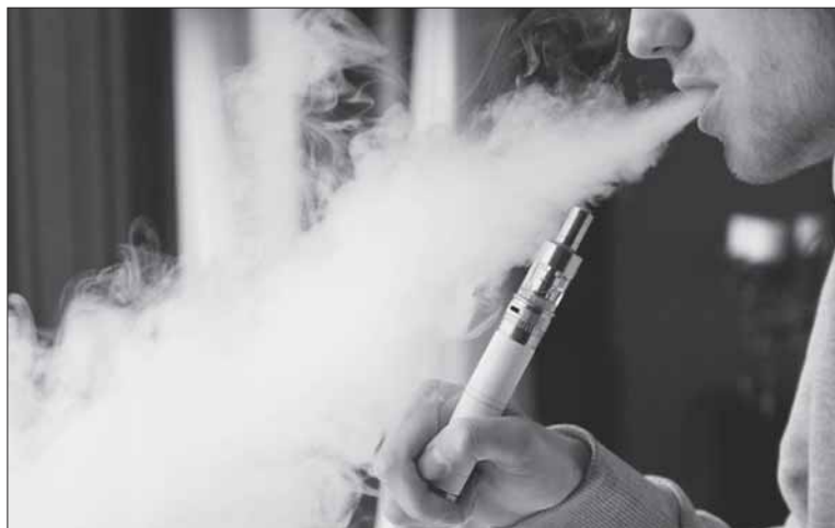
Nežalingo rūkymo būdo nėra, o norint greičiau ir lengviau mesti rūkyti, pirmiausia vertėtų kreiptis pagalbos į specialistus.

Pastebima, nesvarbu, kiek laiko ir ką rūkote, norint mesti rūkyti verta nors tris mėnesius vartoti gy-