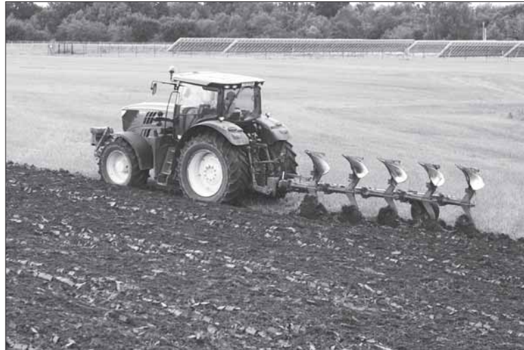
Gauti paskolas, padėsiančias sumažinti finansinius sunkumus, gali tie ūkio subjektai, kurių veikla susijusi su žemės ūkiu.

Norintieji pasinaudoti parama nuo 2020 m. kovo 16 d. turi būti susidūrę su likvidumo problemomis, kurios nustatomos vertinant skubaus padengimo (kritinio likvidumo) rodiklio reikšmę, arba skolos rodiklio reikšmę,