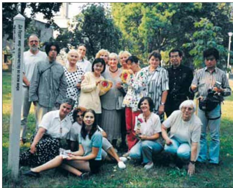
Atsisveikinimo akimirka 2002 08 16.

Tais metais Lietuvoje buvo pastatyti šeši taikos stulpai. 2001 m. –