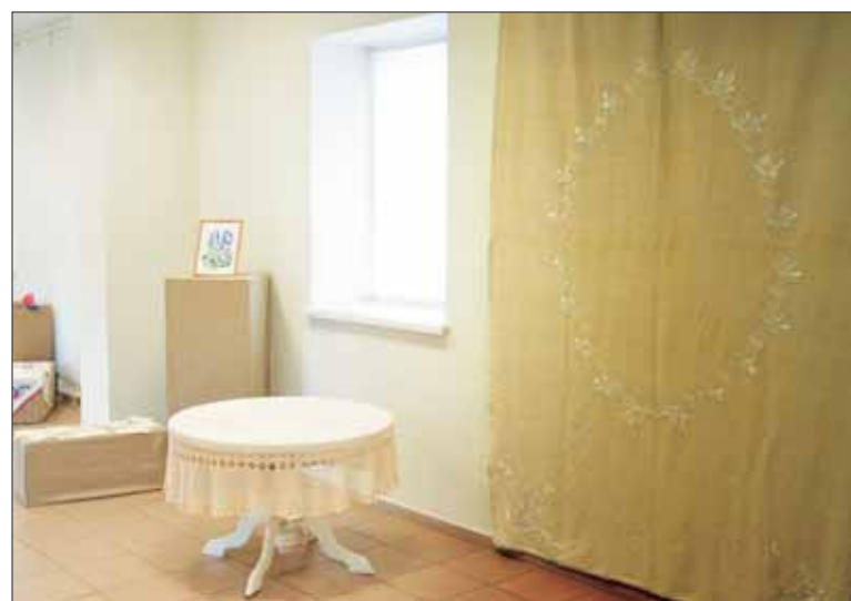
V. Rukienės nėriniai ir siuvinėti rankdarbiai.