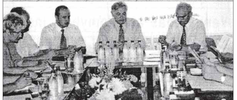
2001 m. liepos 17 d. Konferencijos „Birštono ir Druskininkų kurortai: dabartis ir ateitis“ metu.