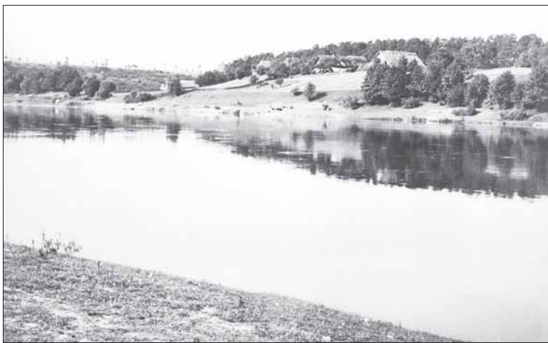
J. Marčiukaitis. Balbieriškio apylinkės, Puzonių kaimo viensėdis, 1930.

Sios ir kitos jo darytos nuotraukos: https://www.google.lt/search?q=J.+Mar%C4%8Diukai%C4%8DITIS&tbm=isch&source=univ&sa=X&ved=2ahUK-EwjS1ayplT7oAhUTzMQB-HarpDdUQsAR6BAgKEA-E&biw=1680&bih=907