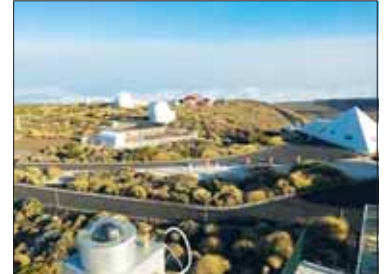
Tenerifės (Grand Canaria) Astrofizikos instituto Teide observatorija.