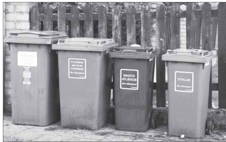
O jūs ar jau įpratote rūšiuoti maisto atliekas?

Kokios dar maisto atliekos! Iš pat pradžių, kai jam tik tą rudą konteinerį atvežė, jis sakė, kad jokių maisto atliekų neturi ir to konteinerio jam nereikia.