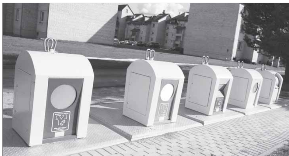
Nauja aikštelė Birštone. Rūšiuokite atliekas ir vietos konteineriuose niekada nepritrūks.