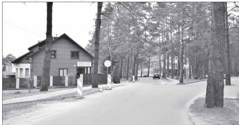
Įrengiama pėsčiųjų perėja prie poliklinikos Paprienėje.

Kelių priežiūros ir plėtros programos lėšų paskirstymo komisijos