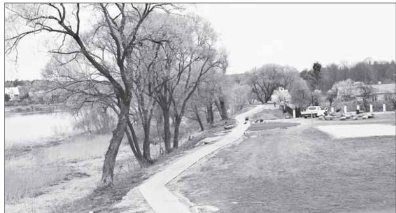
Tvarkoma dešinioji Nemuno pakrantė.