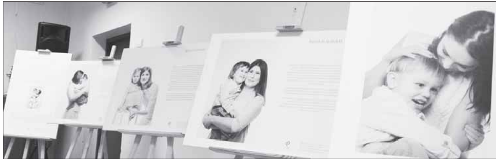
Iš parodos „Kaip gerai, kad tu gimei“.