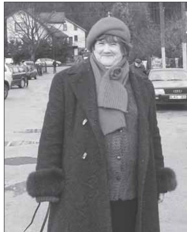
„Ir prekiautojams reikia po turgų pasidaryti ir šį bei tą įsigyti“, – sakė ilgametė turkaus prekeivė iš Pakuonio.