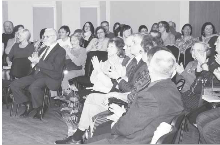
Į kūrybinį vakarą susirinko itin daug autoriams svarbių žmonių.