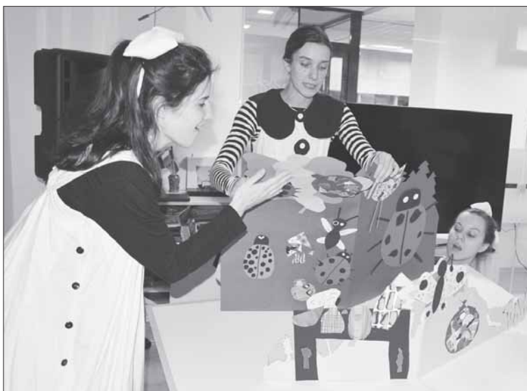
Profesionalios aktorės suvaidino pasaką, kurią sukūrė rašytojas V. Šidlauskas su vaikais.

Lapkričio 28 dieną į Birštono viešosios bibliotekos Vaikų ir jaunimo aptarnavimo skyrių suguzėję jaunieji skaitytojai, tėveliai ir svečiai, pakviesti į projekto „Kurk. Pajausk. Atrask“ baigiamąjį renginį, pateko į nuostabių fantazijų pasaulį, kuriame persipynė visos šio projekto metu vykdytos kūrybinės veiklos, buvo sužadinti vaizdo, garso, skonio, kvapo ir lytėjimo pojūčiai.