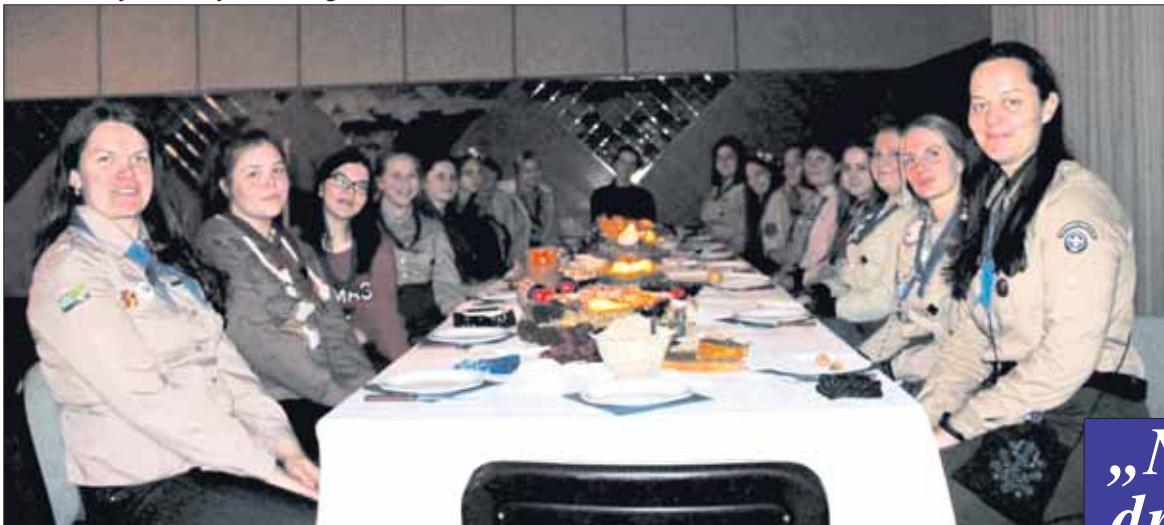
Šimtmečio vyr. skaučių Kūčios.