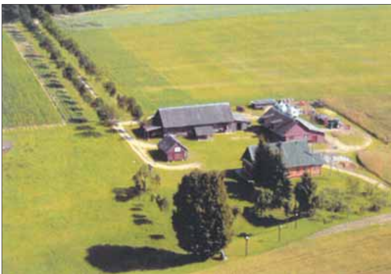
Ažuolų alėja ir atstatyta tėviškė iš paukščio skrydžio.