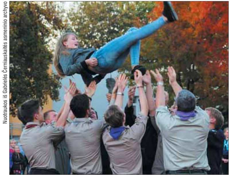
Jei stovyklų metu būna kurio nors brolio ar sesers gimtadienis, skautai turi tradiciją rikiuotės metu mėtyti jubiliatą tiek kartų, kiek jam sukanka metų.