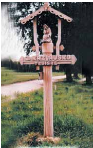
Antroji rodyklė nuo Birštono – pati gražiausia.

Po kiekvienos rodyklės šventinimo ceremonijų tėviškėje įvyko graži šventė – aidėjo kanklės ir skudučiai,