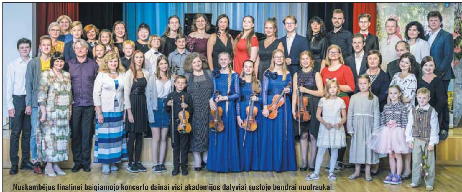
Nuskambėjus finalinei baigiamojo koncerto dainai visi akademijos dalyviai sustojo bendrai nuotraukai.