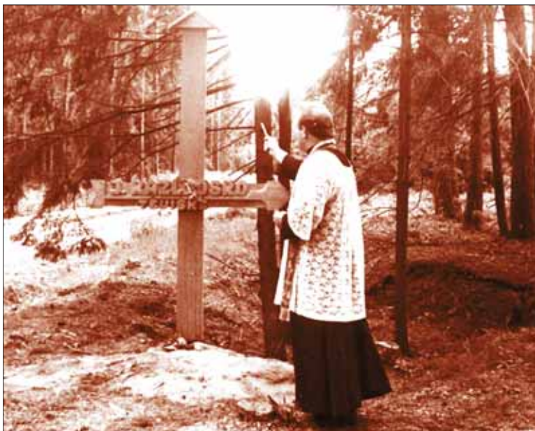
Šventinama ketvirtoji (paskutinė rodyklė) į profesoriaus tėviškę.