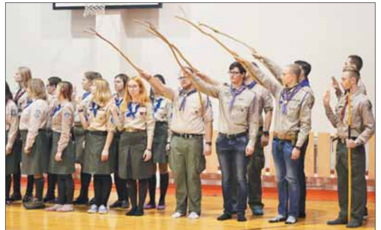
Saliutas rikiuotės metu, kuriuo pagerbiama nuleidžiama arba pakeliama Lietuvos valstybės vėliava. Giedama „Tautiška giesmė“ arba skautijos himnas.

mus, išgyvenimą gamtoje ar įvairius pionerijos (skautų judėjime „pionerija“ vadinamas medinių skersinių sutvirtinimas mazgais ir tų skersinių jungimas į konstrukcijas, – aut. past.) įgūdžius, per tiek metų išmokau būti ištvėringa ir pati dažnai nustebedavau, kiek iš tikrųjų savyje turiu stiprybės. Kai visą savaitę gyvendavome miške ir dieną naktį nenustodavo pliaupti, o maistą ant laužo vis tiek reikėdavo pasigaminti ir patiems rąstų iš miško parsitempti, mūsų niekas neklausdavo, ar esame pavargę ir sušalę. Žinodavome savo pareigas ir nesiskųsdami jas atlikdavome.