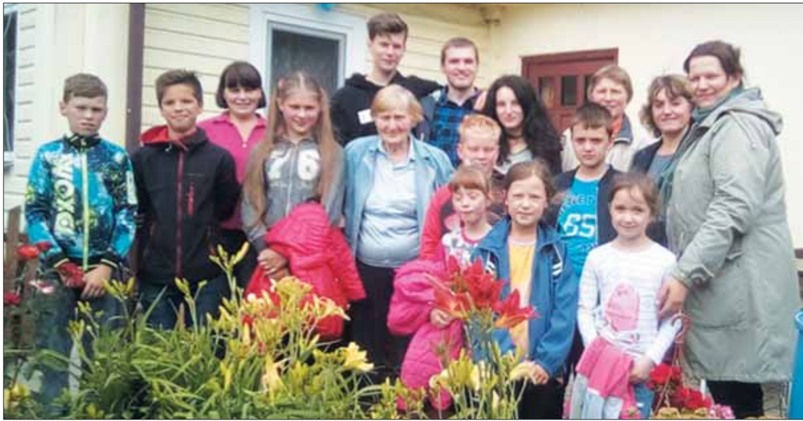
Svečiuose pas Kandrotus Dukurnonių kaime.