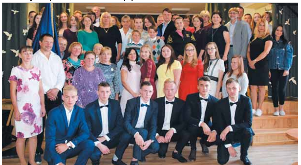
Stakliškiečiai abiturientai - mokytojų, artimųjų ir bičiulių apsuptyje.