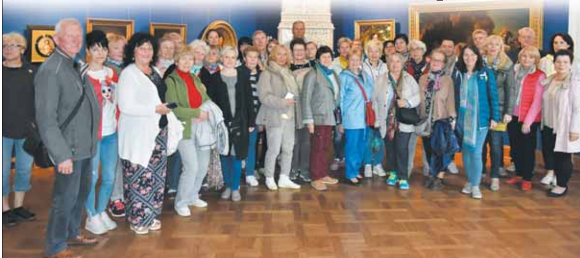
Birštono TAU studentai Jekaterinos I rūmų menėje.