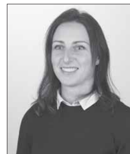
Vita Mendelienė Nr. 12