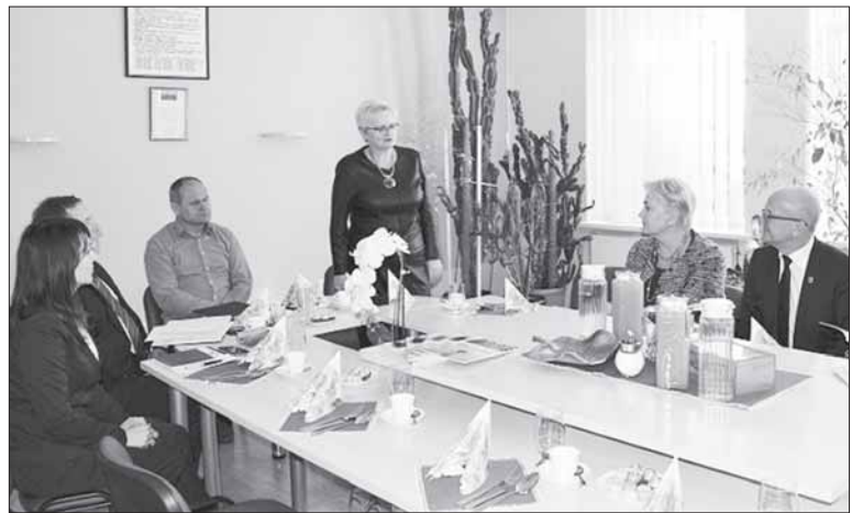
2018 m. spalio 4 d. pasitarimas su Seimo nariais Prienų ligoninėje.

sugebėjo atsikratyti ir šilumos tiekėjo, ir tų rekordinių šildymo sąskaitų. Čia įkvepiantis pavyzdys kitoms savivaldybėms.