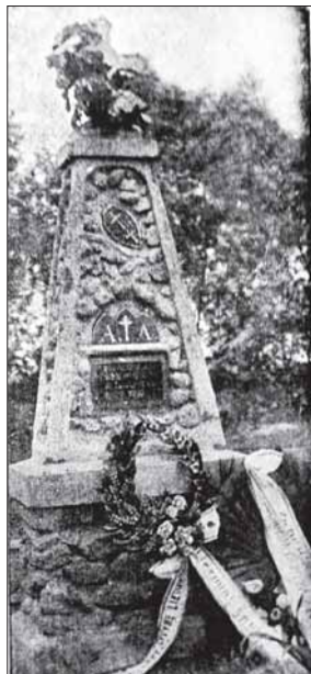
Paminklas žuvusiems kariams 1930 m.