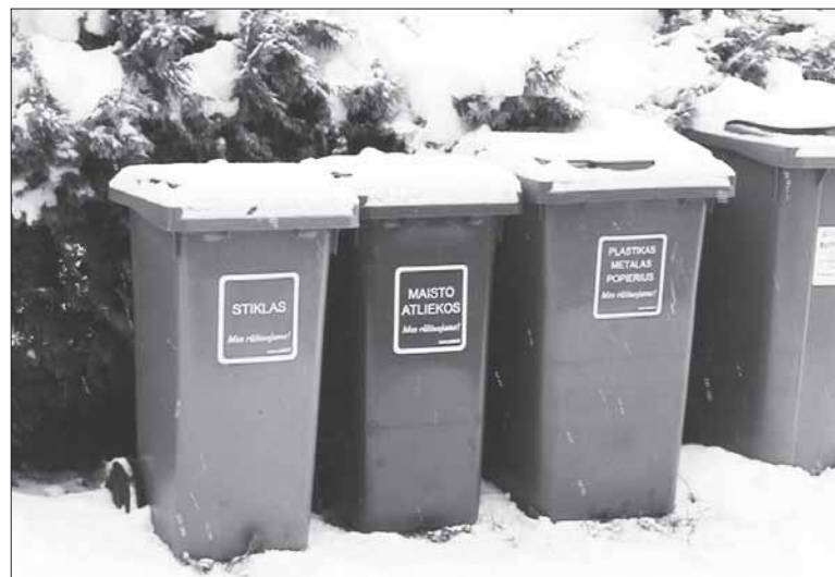
Maisto atliekų susidaro kiekvienuose namuose. Nepamirškite jų rūšiuoti ir ištraukti konteinerių.

Atskirai renkant maisto atliekas joms skirtame kibirėlyje rekomenduojama nenaudoti plastikinio