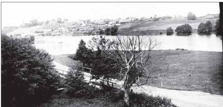
Miestelis iš kitos ežero pusės.