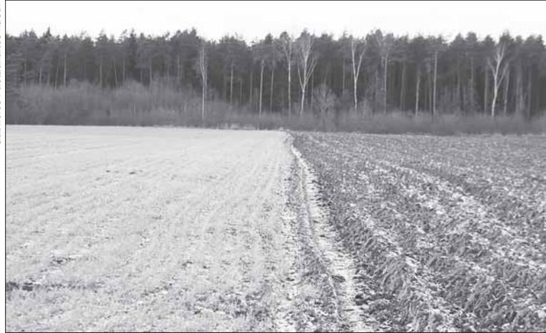
Pasėlius ir augalus nuo rizikų, susijusių su meteorologiniais reiškiniais, 2017 m. draudė 671 ūkis. Apdraustas plotas siekė 201 tūkst. ha.

Tam, kad ūkininkai dar aktyviau naudotųsi draudimo įmokų kompensavimu, nuo rugsėjo