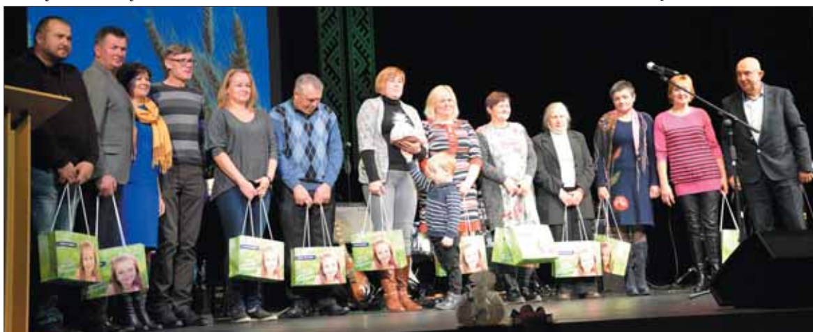
AB „Pieno žvaigždės“ atstovas įteikė dovanas savo klientams, pieno gamintojams.