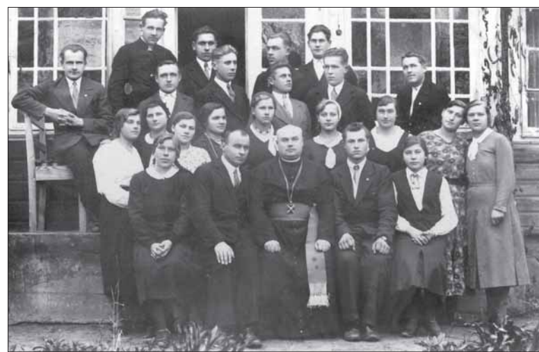
Su pavasarininkais Jiezno klebonijoje 1934 m.