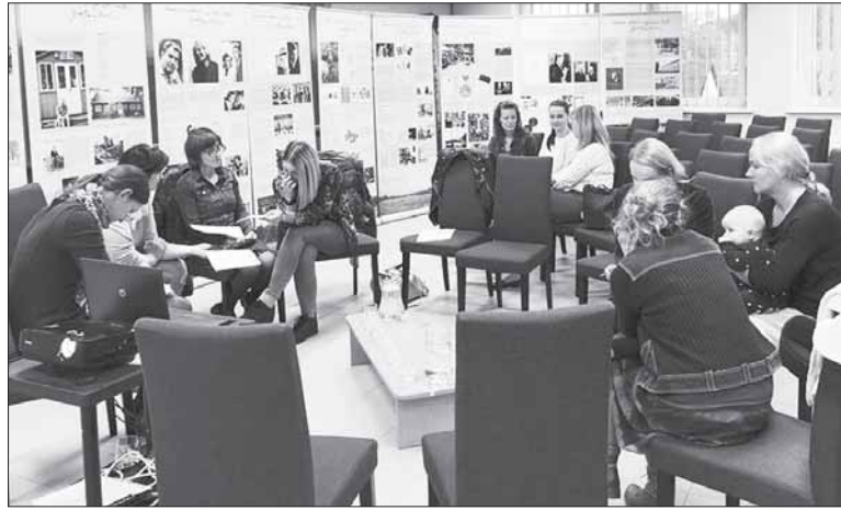
Seminaras tėveliams Just. Marcinkevičiaus viešojoje bibliotekoje.

- Vienas iš labiausiai šeimas motyvuojančių veiksnių - tai, kad visos bendruomeniniuose namuose teikiamos paslaugos yra nemokamos. Jomis gali pasinaudoti visi be išimties Prienuų rajono gyventojai - ir vaikai, ir suaugusieji, ir senjorai. Tai žmonėms netikėta, juk iki tol didžiausio dėmesio ir pagalbos sulaukdavo socialinės rizikos šeimos. Asmeniškai džiaugiuosi, kad valstybė apsisprendė stiprinti tvarkingas, sąmoningas, motyvuotas šeimas, investuoti į pagalbos joms sistemas kūrimą. Palaikymas iš šalies asmenims gali padėti išsugdyti atsparumą gyvenimiškoms problemoms, kad dėl nepalankiai susiklosčiusių šeiminių ar kitų aplinkybių jie