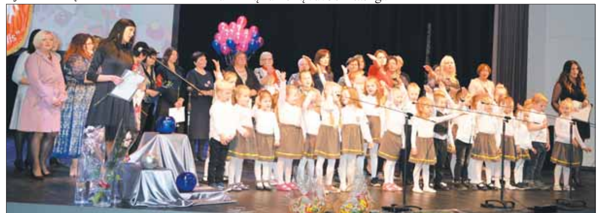
Finalinė šventės dalis.

Prienų rajono ir Birštono krašto naujienos – į kiekvienus namus, į kiekvieną įstaigą, įmonę!