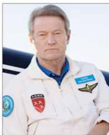
Rolandas PAKSAS, Europos Parlamento frakcijos „Laisvės ir tiesioginės demokratijos Europa“ vicepirmininkas

„Ką Europos Sąjungos Komisijos pirmininkas asmeniškai ir Komisija in corpore galėtų padaryti, kad ir Lietuvoje, Europos Sąjungos valstybėje, pradėtų galioti žmogaus teisių konvencija? Kad piliečiai atgautų savo pilietines teises, o prieš aštuonerius metus priimtas Europos Žmogaus teisių Teismo sprendimas pagaliau įsigaliotų?“ – spalio pabaigoje vykusioje Europos Parlamento sesijoje klausė EP frakcijos „Laisvės ir tiesioginės demokratijos Europa“ vicepirmininkas Rolandas Paksas.