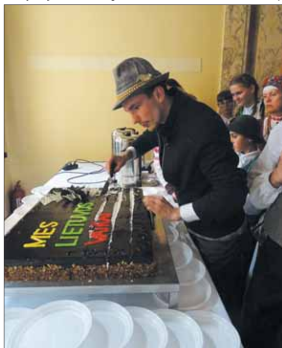
Į šimtą dalių, po 100 gramų kiekvienam ansambliui, dalinamas Lietuvos šimtmečio tortas.