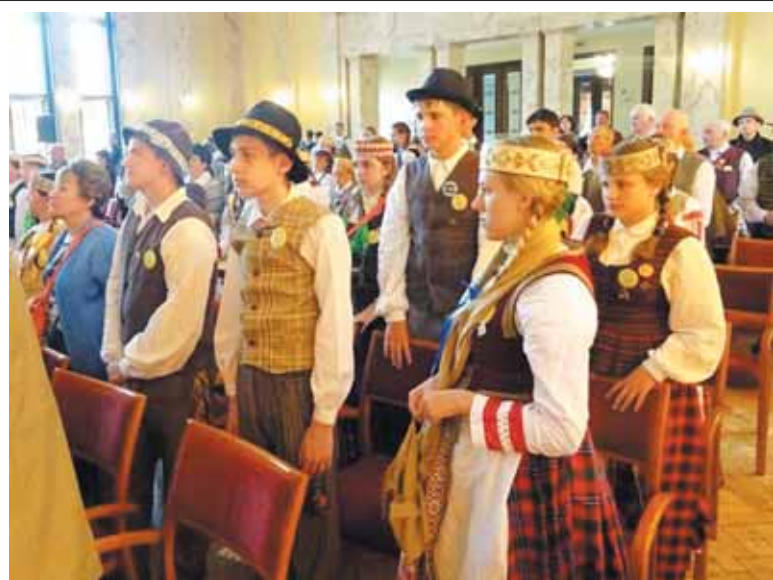
Jaunieji Karaliaučiaus lietuviukai Ramovės salėje.