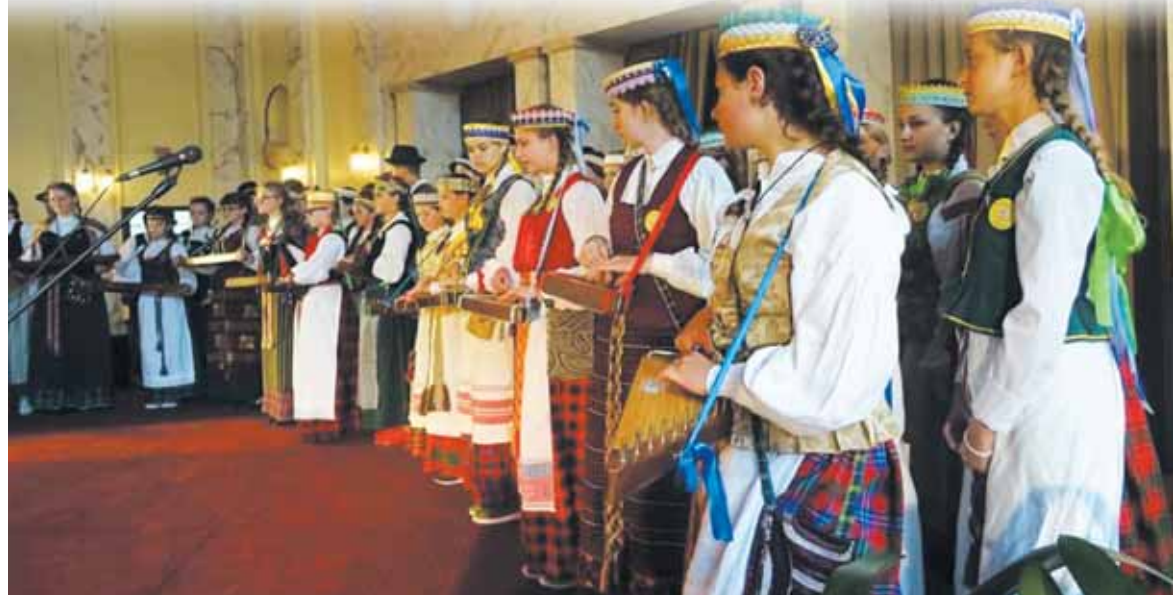
Akimirka iš šių metų liepos 4 d. Kauno [gulos Karininkų Ramovėje vykusios Karaliaučiaus lietuvių dienos „Mes, Lietuvos vaikai“. Koncertuoja jungtinis Karaliaučiaus lietuvių vaikų folkloro ansamblis.